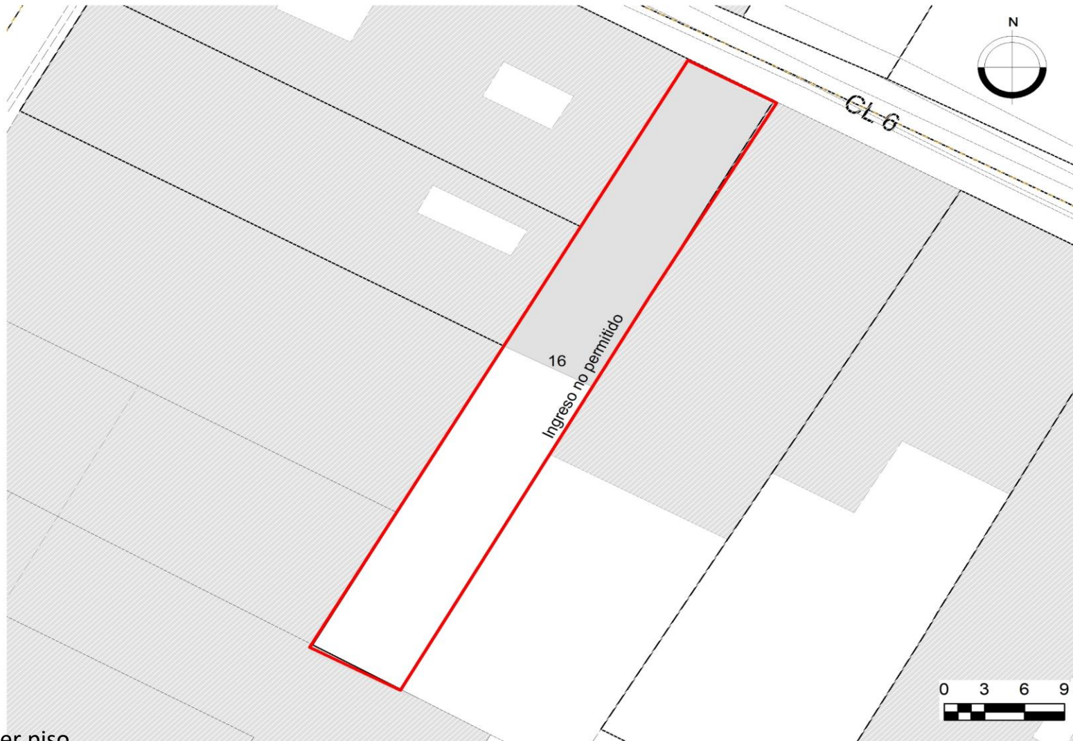
Planta primer piso